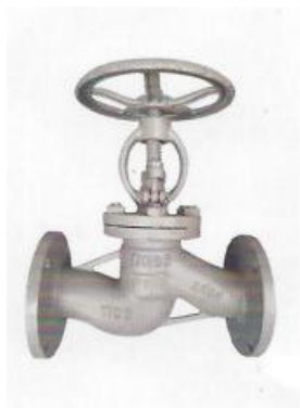
КЛАПАН ЗАПОРНЫЙ (ВЕНТИЛЬ) ФЛАНЦЕВЫЙ (15С65НЖ) РУ 1,6 МРА (16КГС/СМ2)