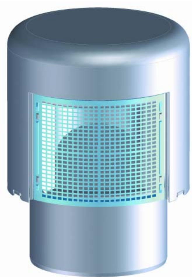
HL 900N (NECO)