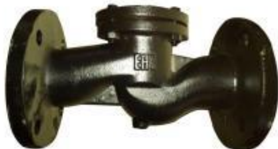
КЛАПАН ОБРАТНЫЙ ПОДЪЁМНЫЙ ЧУГУННЫЙ 16к49нж